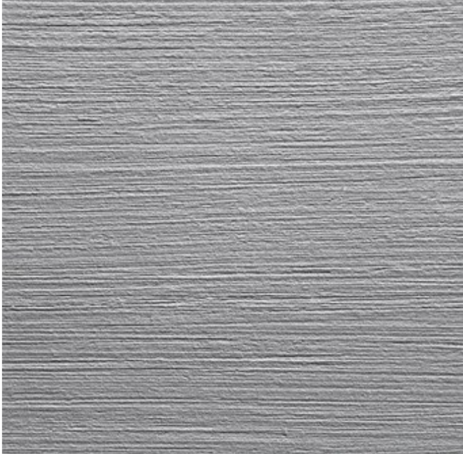
Struktur - hellgrau