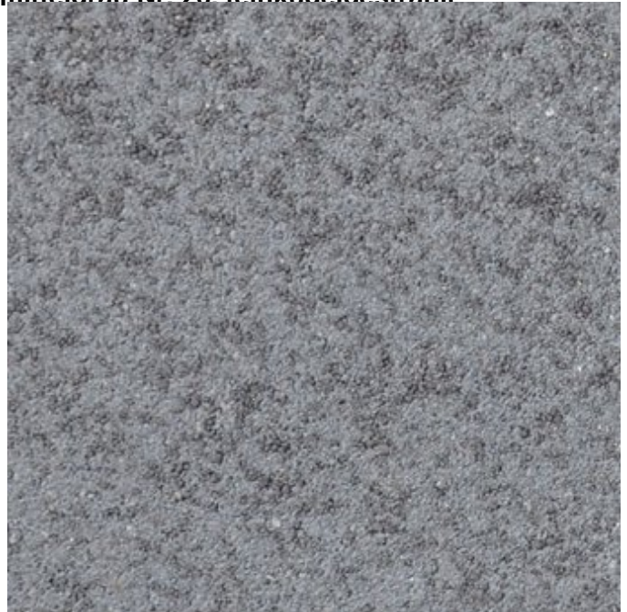
grau-anthrazit, gemasert mit CleanTop®