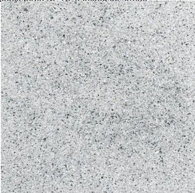
hellgrau Nr. 75, feinkugelgestrahlt