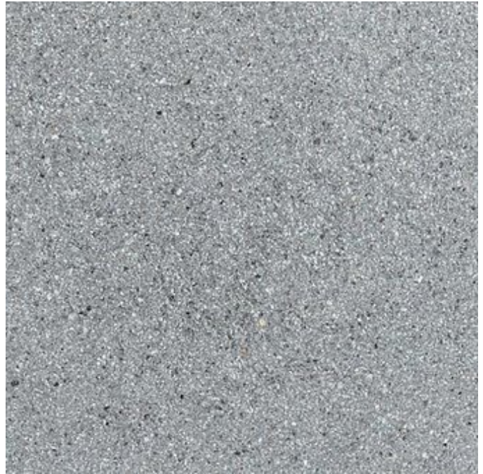
mittelgrau Nr. 26, feinkugelgestrahlt