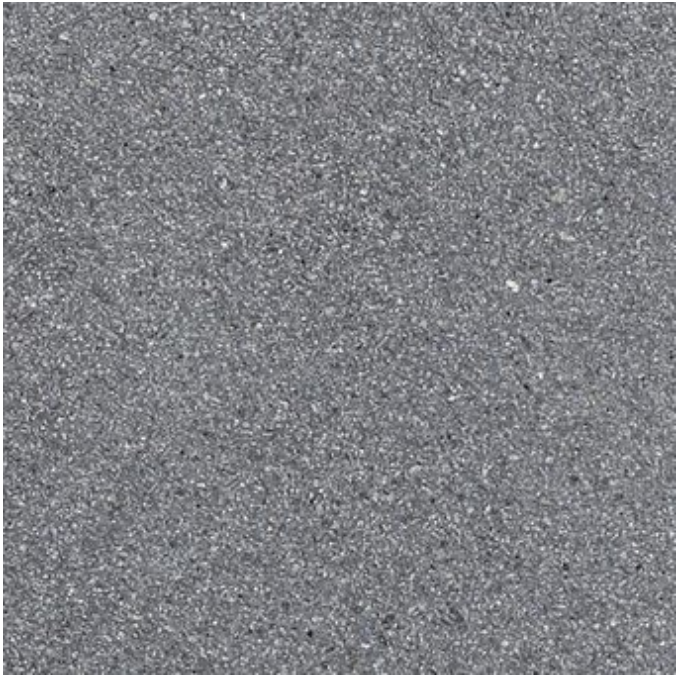
dunkelgrau Nr. 76, feinkugelgestrahlt