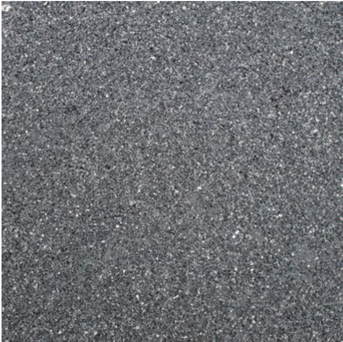
basaltanthrazit Nr. 67, feinkugelgestrahlt