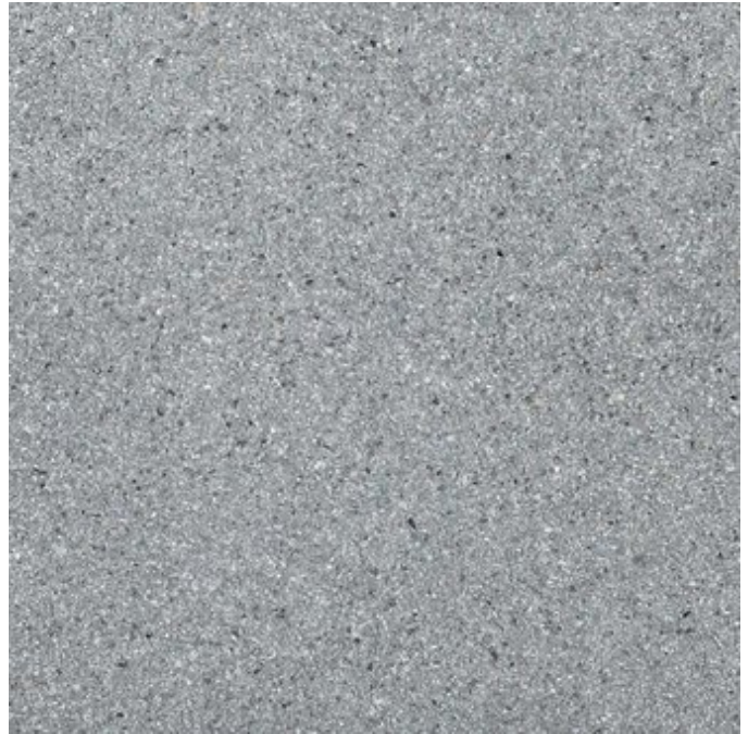
mittelgrau Nr. 26, feinkugelgestrahlt